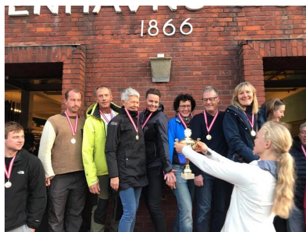
Vinder af Harbour Race Mix Master 8