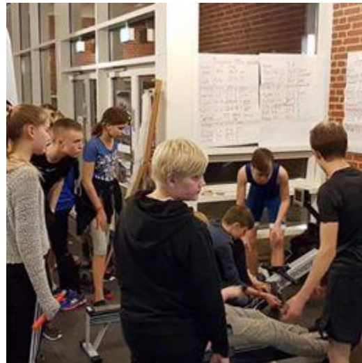
Lørdag i hallen