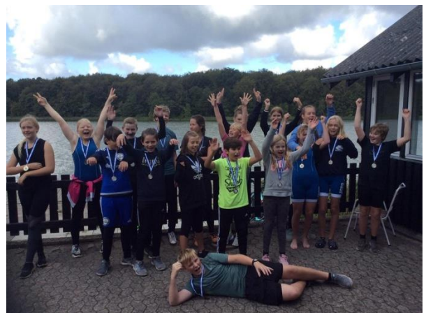
Unge i roklubben 2019