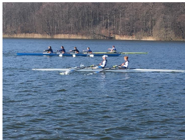
Paraderoning i det gode vejr.