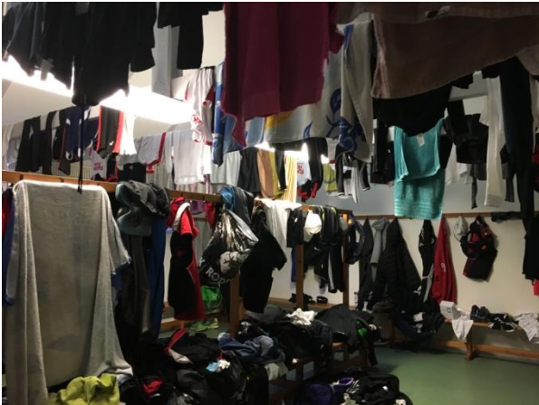
Omkledningsrum under træningslejr.

Dernæst besøg af mentaltræner som lærte dem at håndtere tanker og forberedelse til konkurrence.