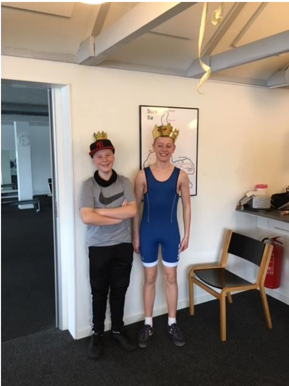
Kong August og Dronning Mads

Fastelavn er blevet genindført en Konge og Dronning er blevet fundet.