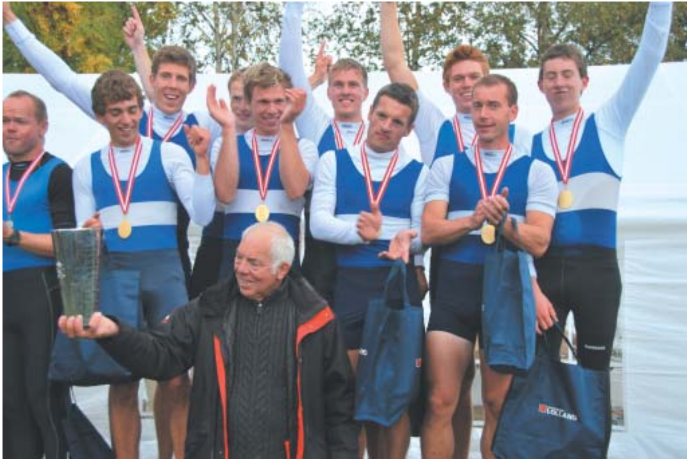
DM i Maribo 2008