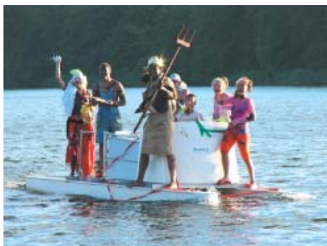
Kong Neptun med følge ankommer standsmæssigt

Sorø Roklub har markeret sig flot med en lang række danske og internationale placeringer.