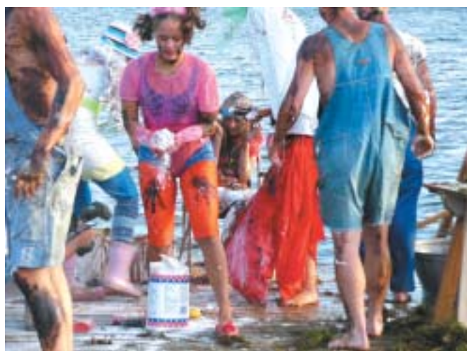
Dåben går lystigt for sig