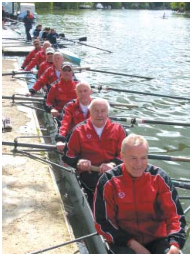
Der lægges fra broen i Henley i en fremragende otter

Første udlandsrejse gik faktisk til noget så eksotisk som Grønland. Ved Kangerlussuaq – Søndre Strømfjord – ligger en lille sø hvortil SAS Roklub har fået transporteret et par både. Så hertil drog i 2004 en gruppe på otte morgenroere for at afprøve roning i arktiske områder. Herefter er det gået slag i slag med de udenlandske træningslejre.