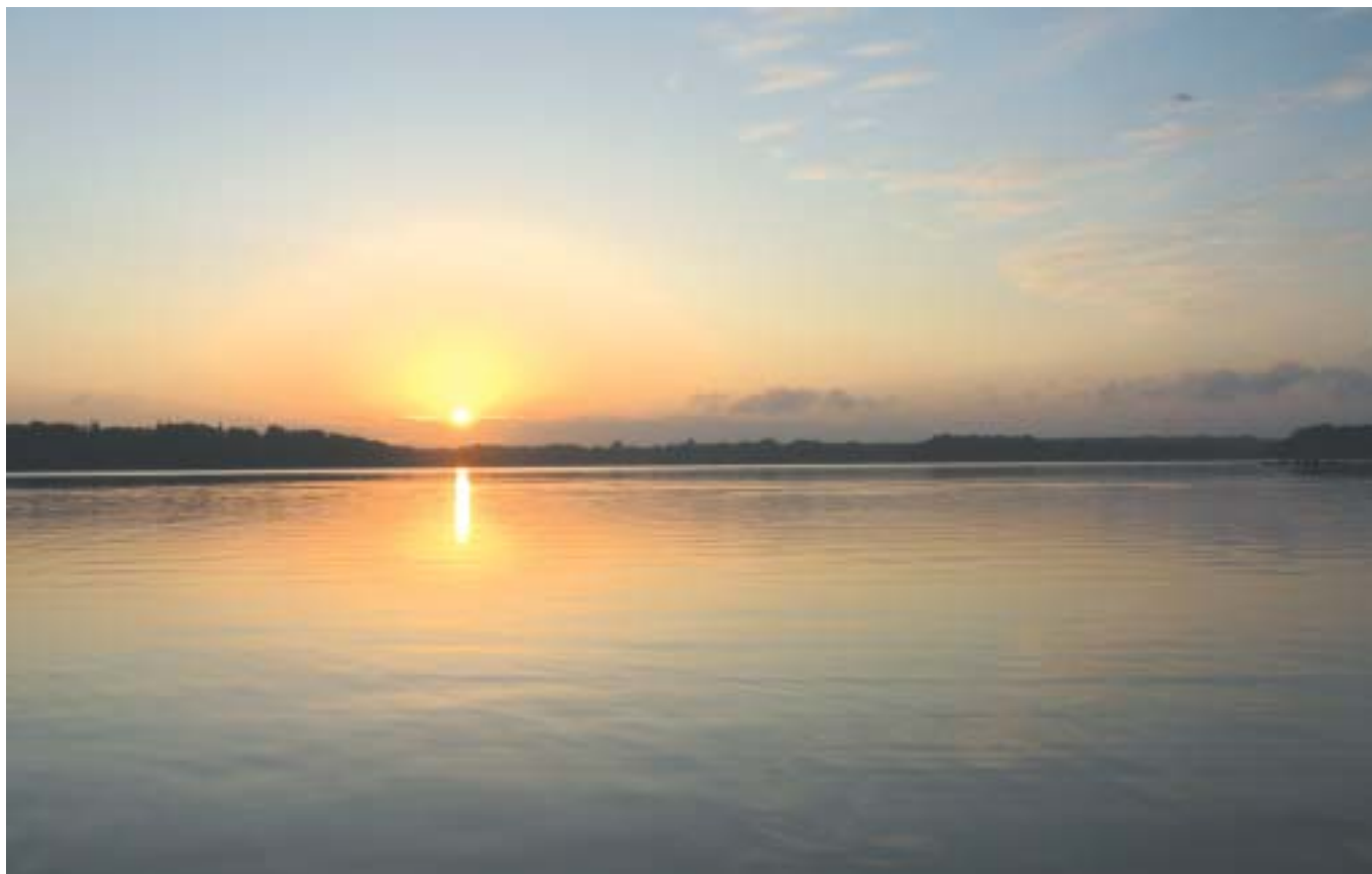
September morgen - Sorø sø