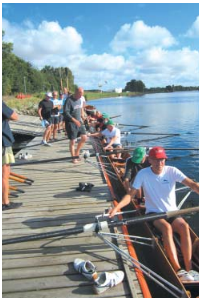
Træningstur til Odense Roklub

20 til 30 km i det gode farvand og gunstige klima, og hotelværten Antonis yder en superb og velmagende betjening.