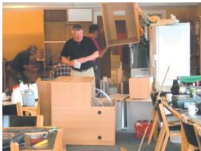
Nyt køkken installeres

- en nem og hurtig måde at få et budskab ud på, men desværre også et medie, hvor budskabet stille og roligt forsvinder i takt med tiden. Roklubbens hjemmeside fungerer med de overordnede meddelelser, men her kræver det et stort stykke arbejde at holde siden opdateret og vedligeholdt.