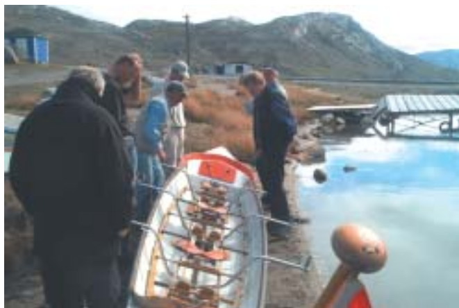
Båden gøres klar til tur på søen ved Kangerlussuaq

Morgenroerne dyrker roningens glæder og det sociale samvær på tværs af klubgrænser. I mange år har der bestået en særlig tæt forbindelse mellem Københavns Roklub, KR og Sorø Roklub. Det udmønter sig i årlige træf, hvor der skiftevis ros i Københavns kanaler og på Sorø Sø med efterfølgende gode frokoster. For en del år siden flyttede nogle af aktiviteterne udenlands, idet der arrangeredes træningsophold under fremmede himmelstrøg.