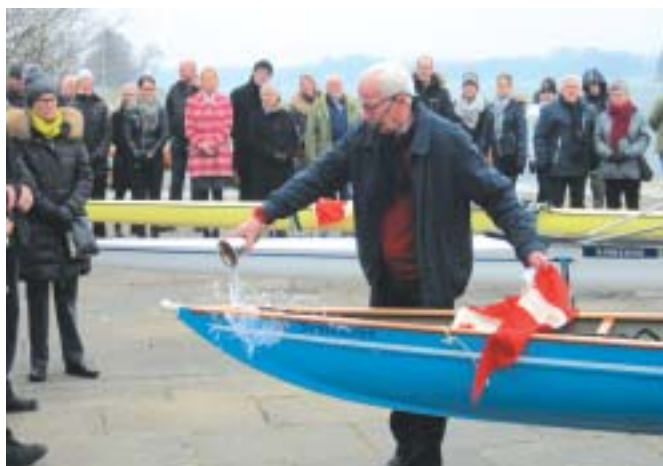
Den nye dobbeltgig-firer døbes

Her i jubilæumsåret er det dejligt at konstatere, at Sorø Roklub er en af de klubber i Danmark med den flotteste bådpark. Vi har nu kun omkring 5 træbåde tilbage fra 70- 80'erne, resten af de ca. 50 både klubben råder over, er plast og fiberbåde. Med så stor en bådpark er vi desværre også nød til at skille os af med både, efterhånden som der kommer nye til. Der er simpelthen ikke plads til at fylde flere både ind i bådhalerne.